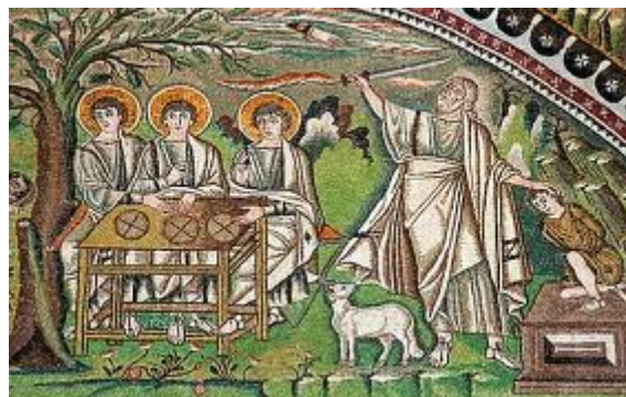
Ábrahám és Izsák - mozaik, részlet, 6. század, Ravenna-i San Vitale bazilika