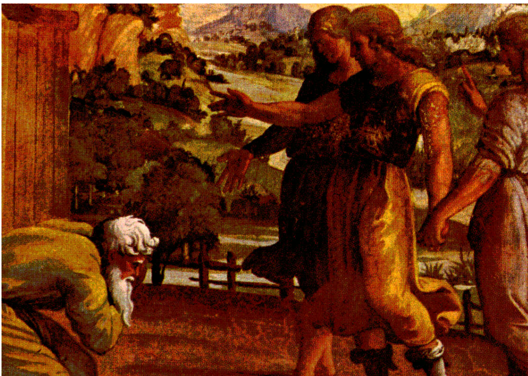
Raffaello: Ábrahám és a három angyal