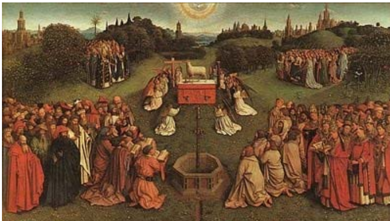
J. Eyck: A Bárány misztikus menyegzője (1425-29)

Isten pedig, nem fárad bele abba, hogy minduntalan meghívjon minket. Többszöri visszautasításunk ellenére sem mond le rólunk.