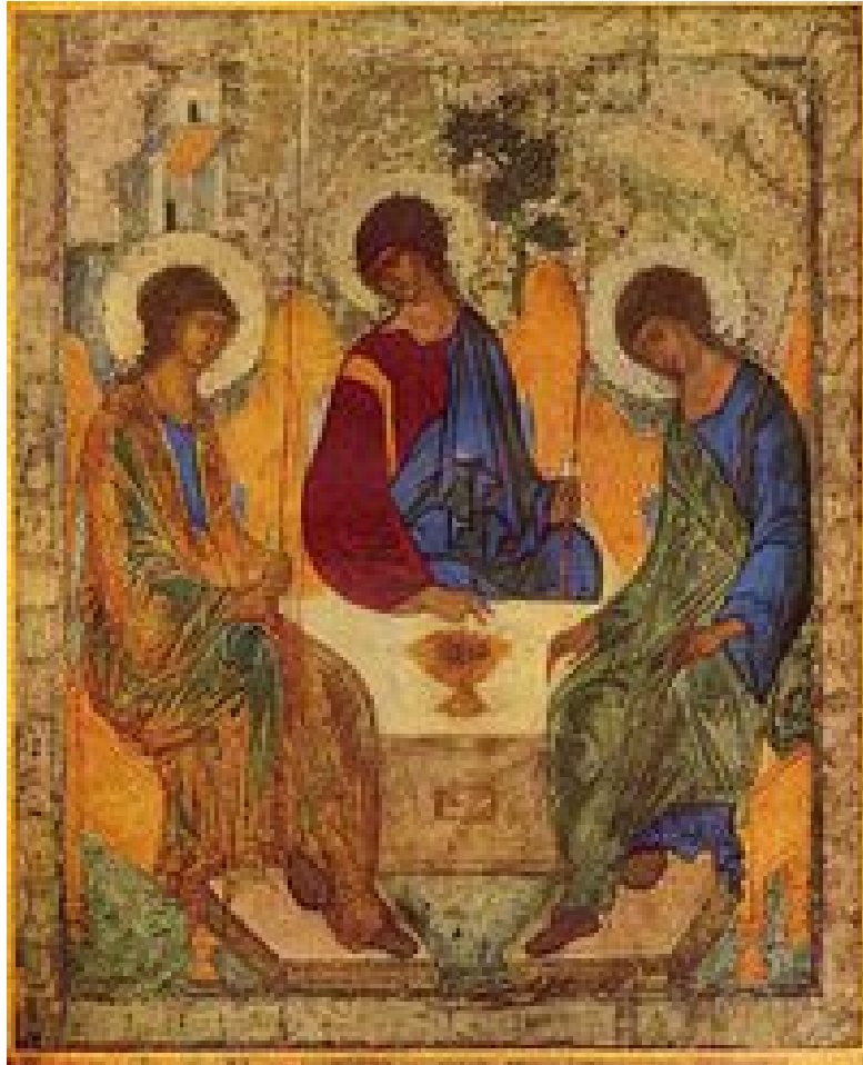
Andrej Rubljov: Szentháromság

Andrej Rubljov, a legismertebb orosz ikonfestő.