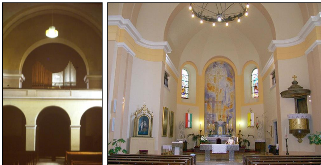
Új orgona a kóruson, új oltárkép a szentélyben és szembenéző oltár, 1980