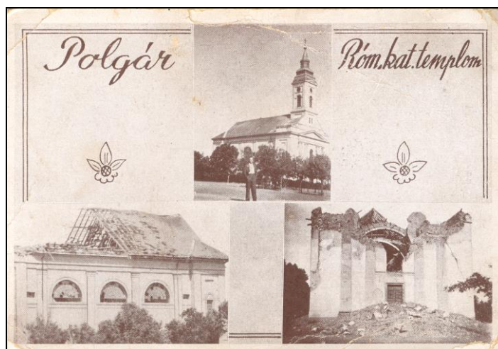
A Nagyboldog-asszony templom 1930-ban és a romjai 1944. október 31. után (Korabeli képeslap)